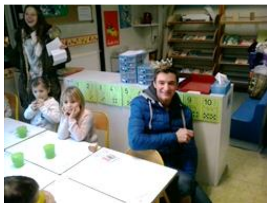
... ont eu les fèves!