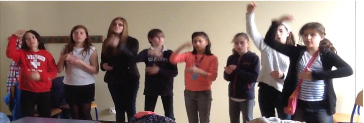
Atelier Langue Des Signes Françaises

Dans la vie des élèves il y a aussi les temps périscolaires : les moments de repas, les ateliers, les fêtes, les récréations. Dans ces moments la bienveillance de leurs pairs est aussi gage de réussite de leur scolarité. La présence de l'AVS et de tous les autres adultes (CPE – Conseillers d'éducation – Personnels de cantines et d'accueil) assure « le vivre ensemble ».