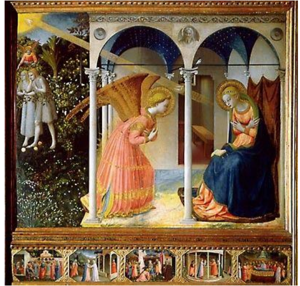
« L'annonciation » de Fra Angelico

Le musée « Reina Sofia » est un musée national espagnol d'art moderne et contemporain. Il présente des oeuvres couvrant la période du 20 ème siècle à nos jours.