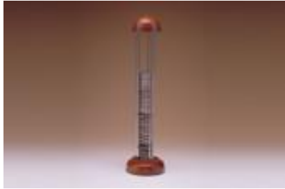
Pile de volta

Ce musée contribue à l'éducation scientifique qui permet de comprendre les méthodes scientifiques et de valoriser le patrimoine historique.