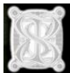
Le stade Berbabéu et le logo