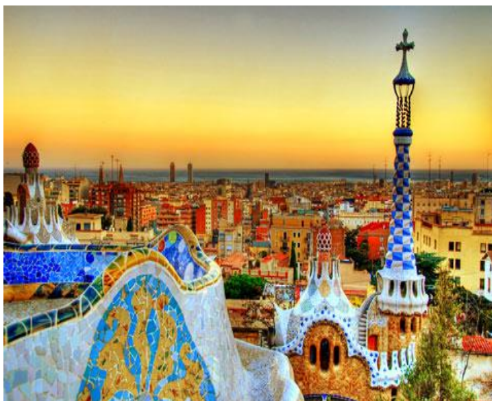
Le Park Guëll

Ce projet devrait permettre aux élèves :