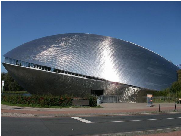
Le Musée des Sciences et Techniques