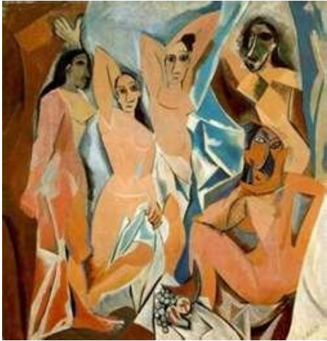
Les Demoiselles d'Avignon