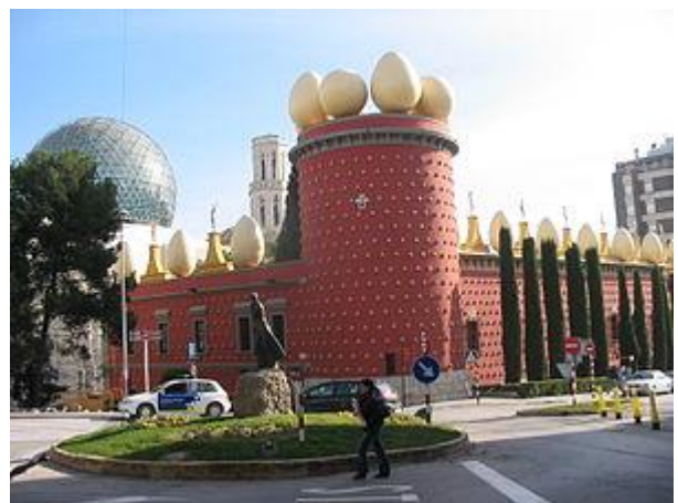
Le Théâtre-Musée Dali