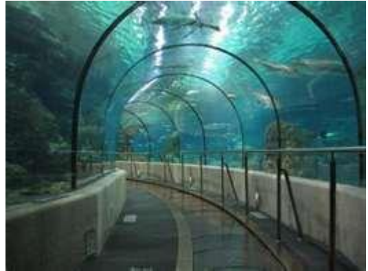
Le tunnel aux requins