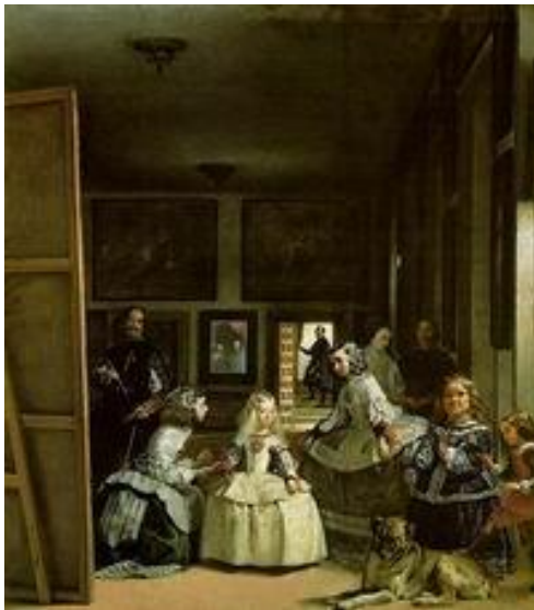
« Les Ménines » de Velasquez

Il présente les oeuvres des peintres européens du 14 ème au 19 ème siècle, oeuvres collectionnées par les Habsbourg et les Bourbons.