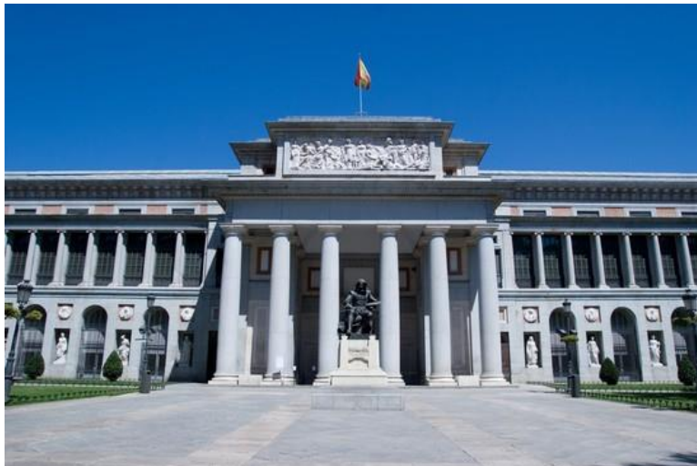
Le musée du Prado

Ce projet devrait permettre aux élèves :