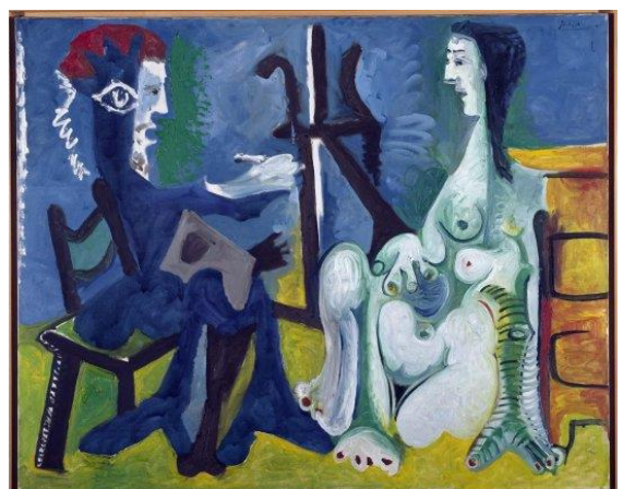
« Le peintre et son modèle »