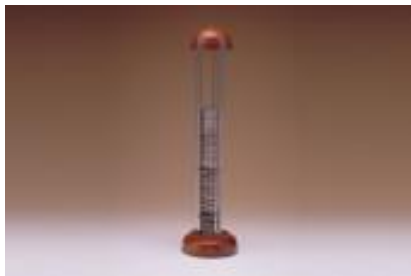
Pile de volta

Ce musée contribue à l'éducation scientifique qui permet de comprendre les méthodes scientifiques et de valoriser le patrimoine historique.