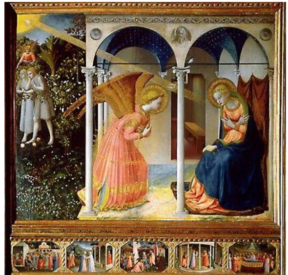
« L'annonciation » de Fra Angelico

Le musée « Reina Sofia » est un musée national espagnol d'art moderne et contemporain. Il présente des oeuvres couvrant la période du 20 ème siècle à nos jours.