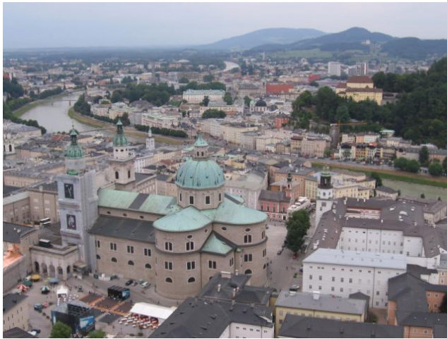
Vue sur la cathédrale depuis la forteresse Hohensalzburg