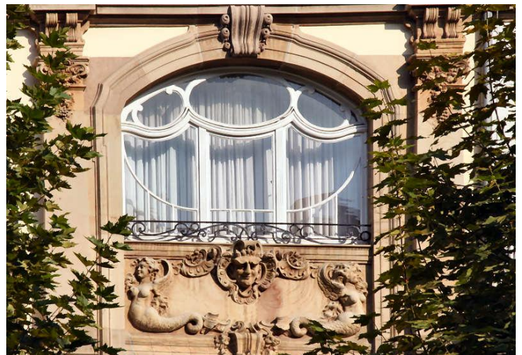
Façade « Art Nouveau »