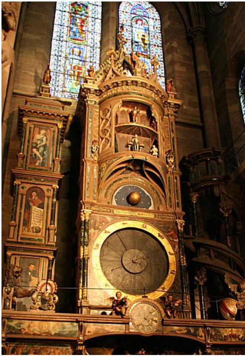
Horloge astronomique de la cathédrale