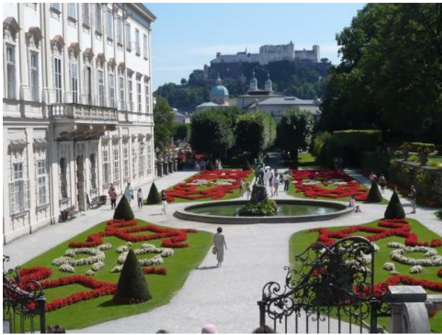
Le château Mirabel