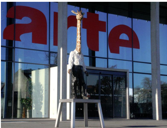
Entrée du siège d'ARTE