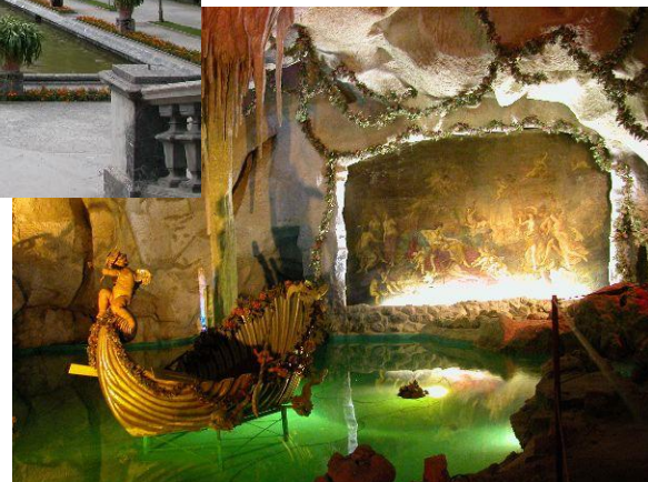
La grotte de Vénus